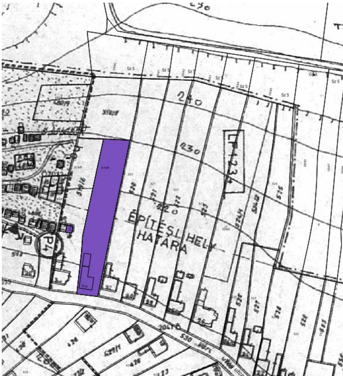
Hatályos szabályozási terv – az érintett telkek megjelölésével

Az önkormányzat sikeresen pályázott a TOP-1.2.1-16 "Történelmi pincesor rekonstrukciója és a szőlőtermelés hagyományai Gyöngyöspátán" elnevezésű pályázatra. A pályázatban szerepel egy épület építése (konferenciaterem, állandó kiállító terem, kiszolgáló helyiségek), a terület a hagyományos szőlőművelés bemutatásához, valamint pince és préház a borkészítés bemutatásához. Ehhez szükséges az 519/5 és az 519/8 helyrajzi számú ingatlanok kisajátítása.