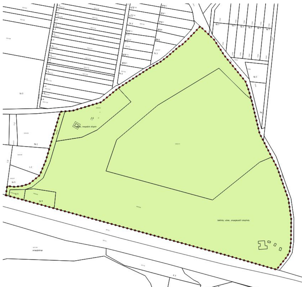
Hatályos településszerkezeti terv részlet - 2. tervezési terület