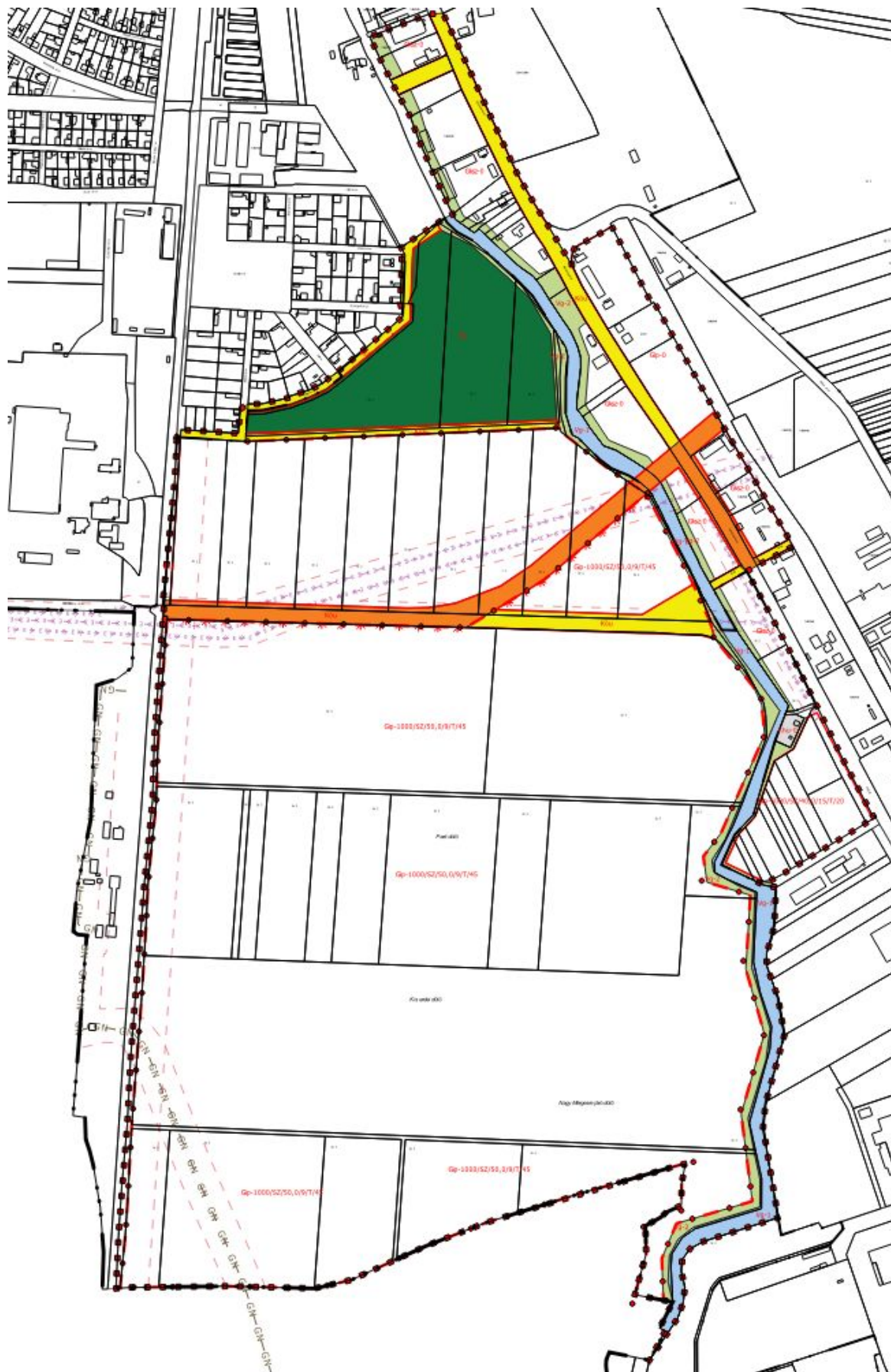
Hatályos szabályozási terv részlet - 1. tervezési terület