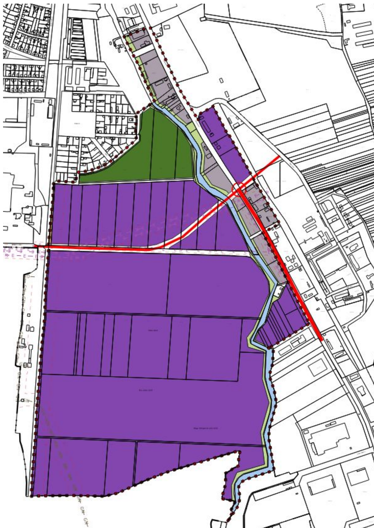
Hatályos településszerkezeti terv részlet - 1. tervezési terület