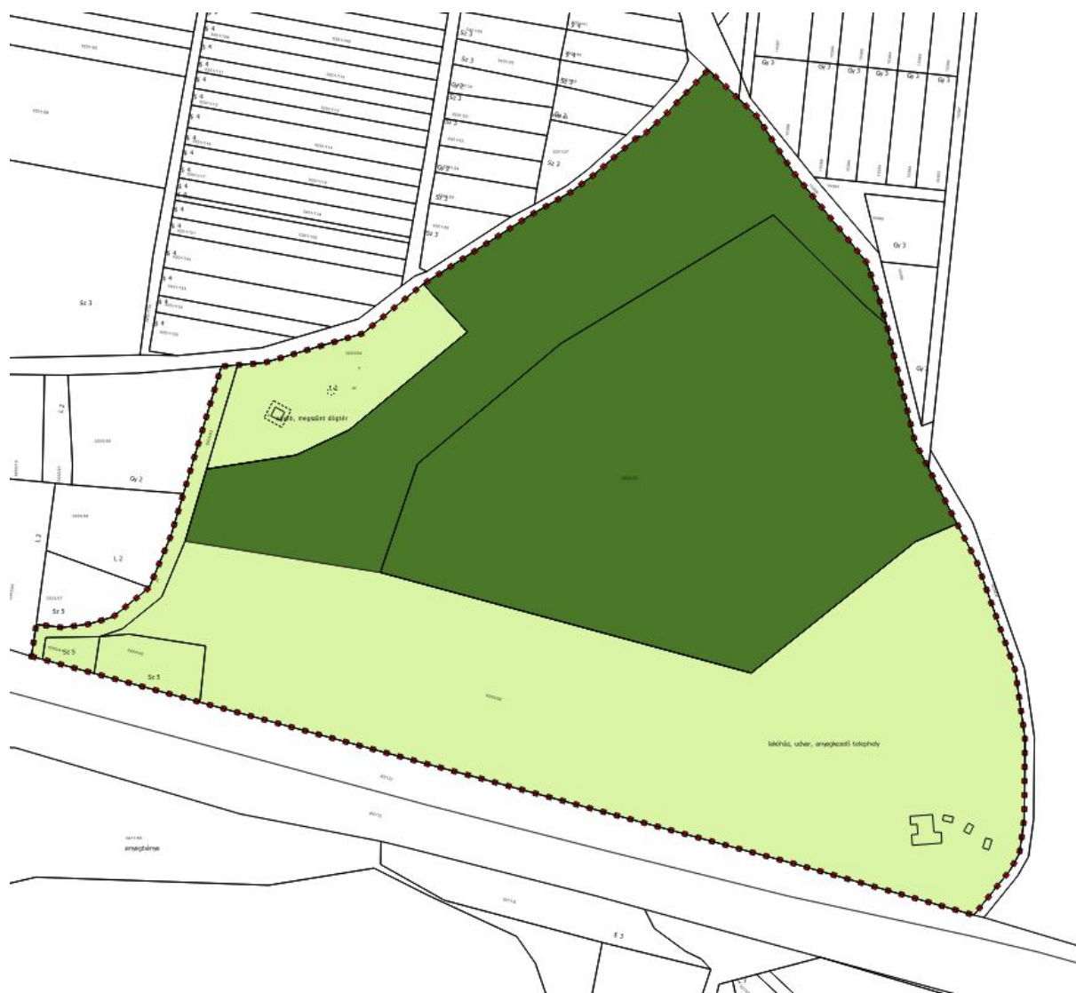
Tervezett településszerkezeti tervlap - 2. tervezési terület