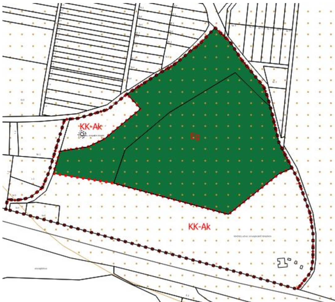
Tervezett szabályozási terv részlet - 2. tervezési terület