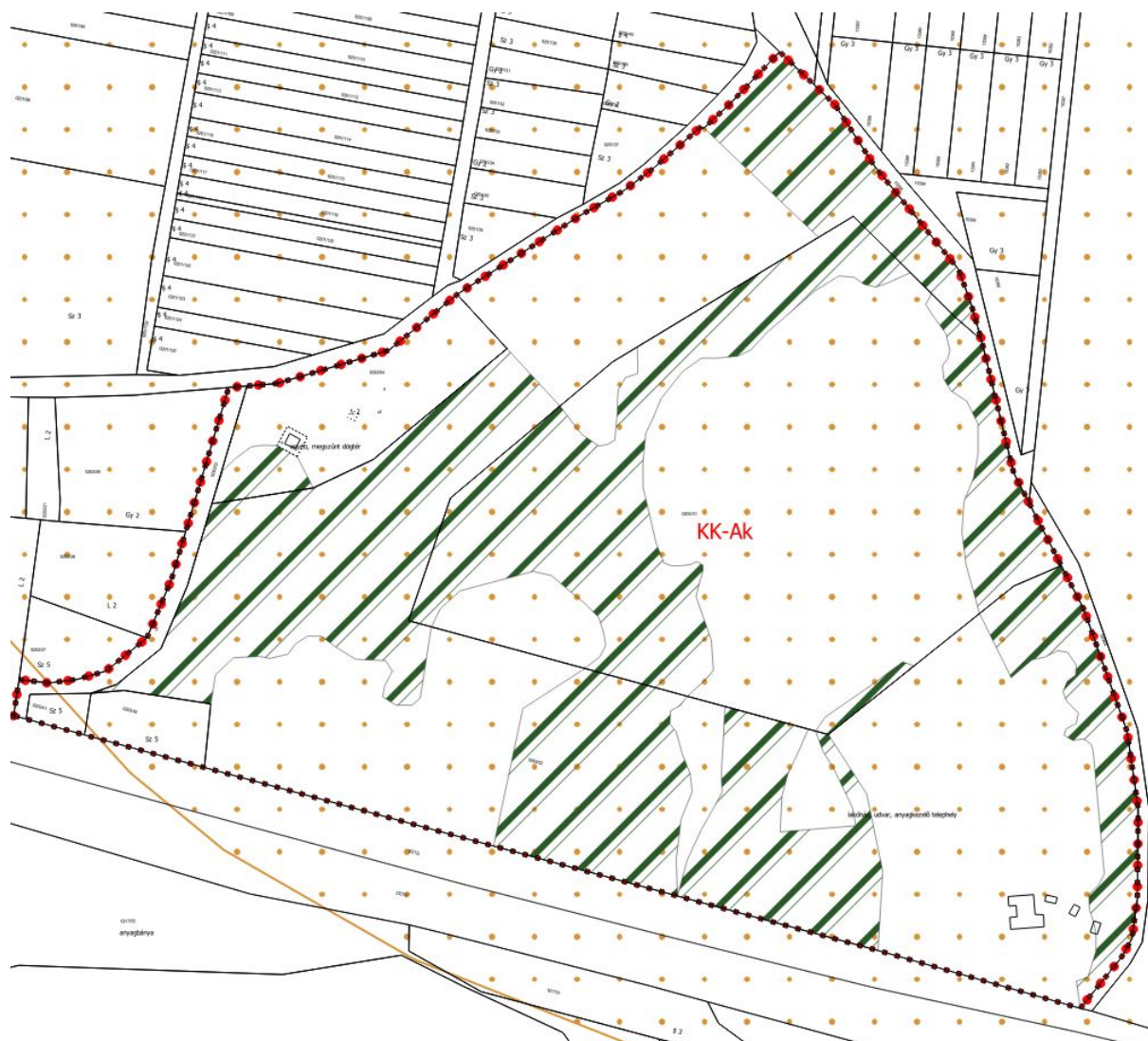
Hatályos szabályozási terv részlet - 2. tervezési terület