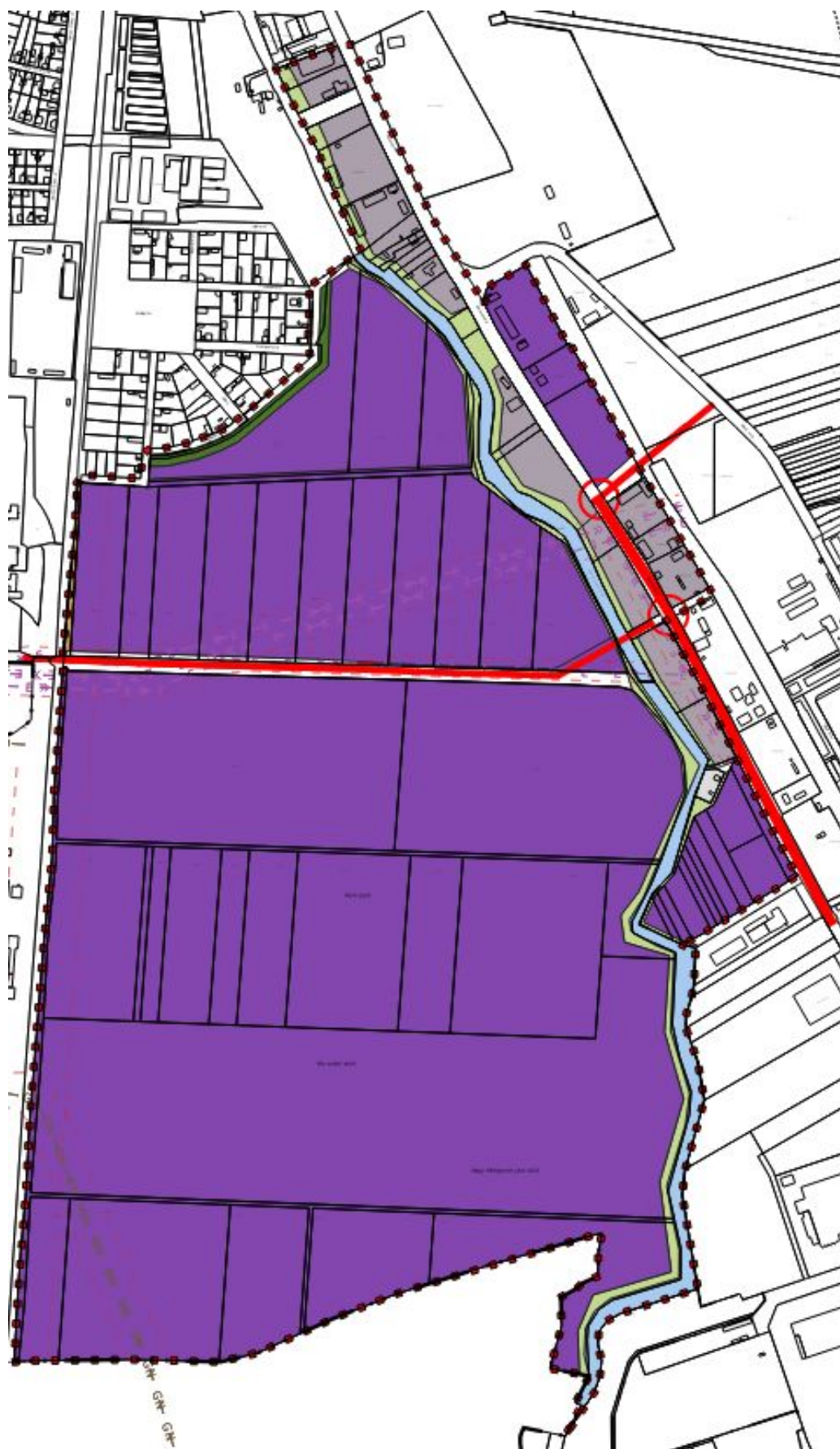
Tervezett településszerkezeti terv részlet - 1. tervezési terület