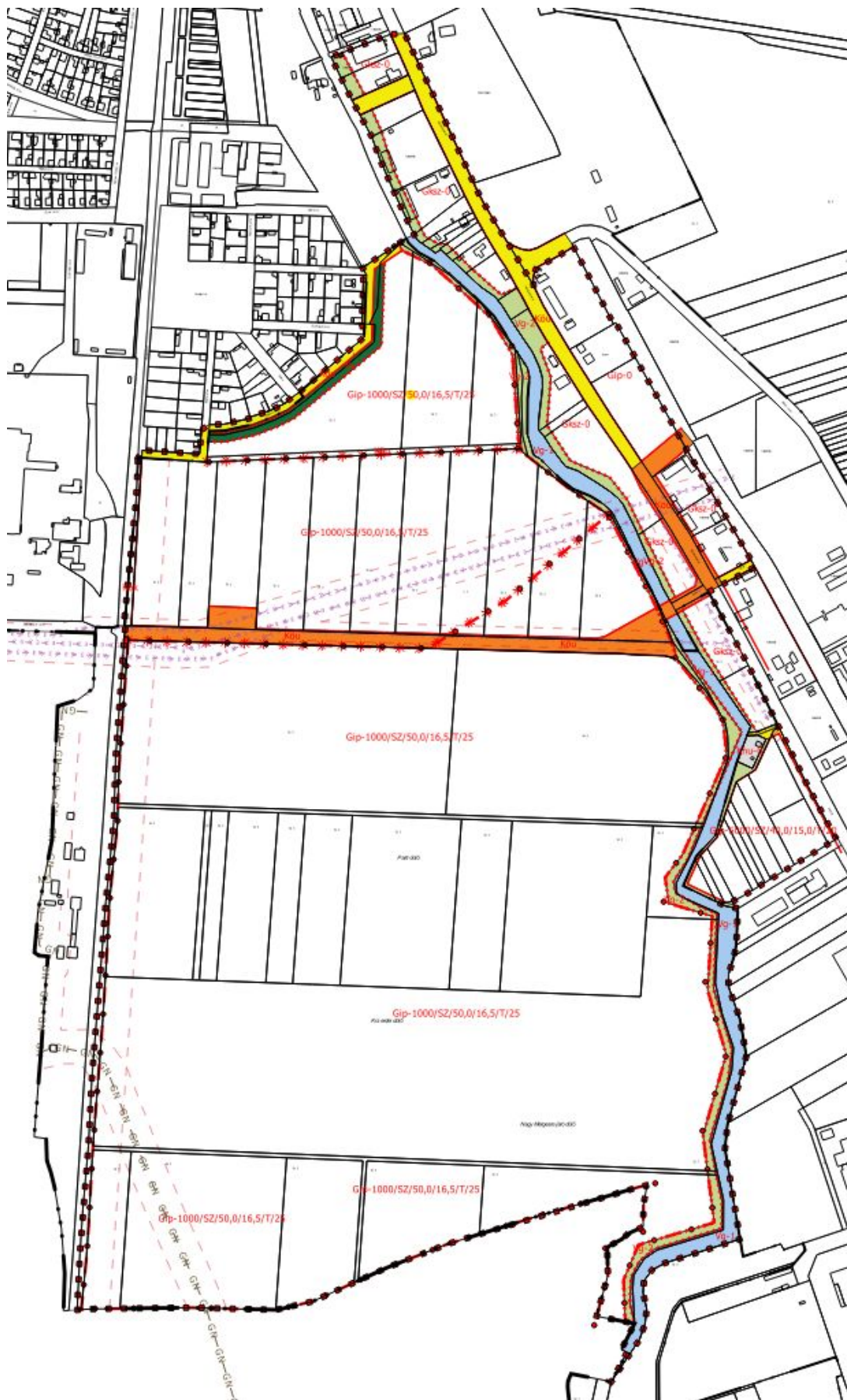
Tervezett szabályozási terv részlet - 1. tervezési terület